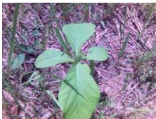
Champ d'1 ha de teck à Dzogbé

Chaque site est dirigé par un volontaire d'aide locale.