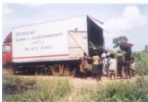
Transport des plants

Les plants sont achetés à Kpalimé et transportés sur les divers lieux de plantations.