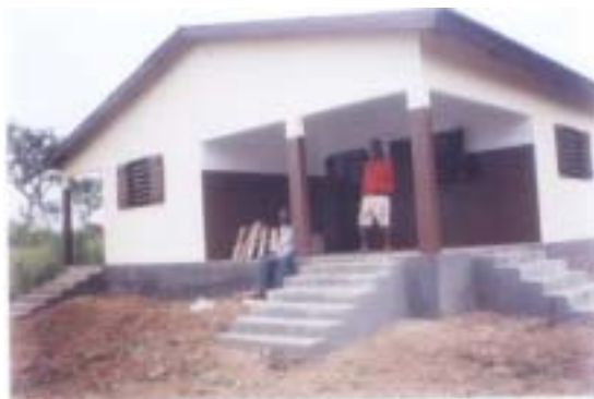
La case de santé de Toxomé.

matrone et de vie des malades et femmes enceintes du milieu.