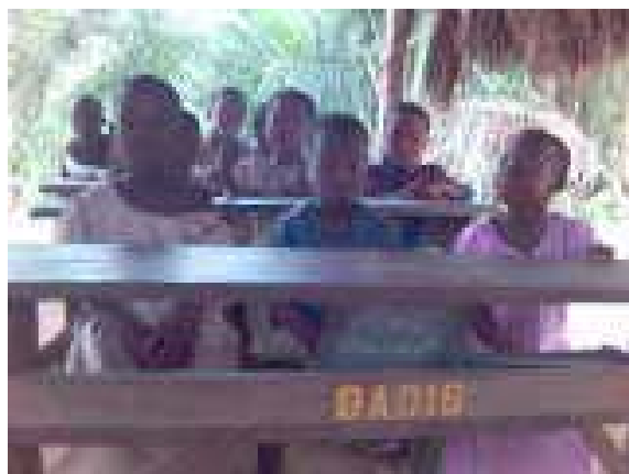
Les élèves du CE2 de l'école

Les volontaires enseignants ont accompagné 64 enfants dans leurs éducations primaires dans le hameau