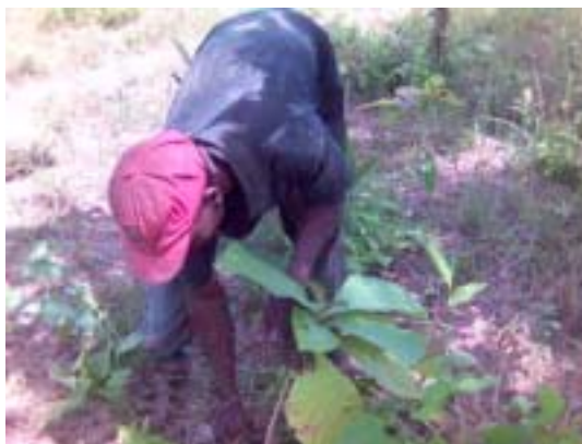
Travaux de plantation d'1 ha de tecks à Toxomé