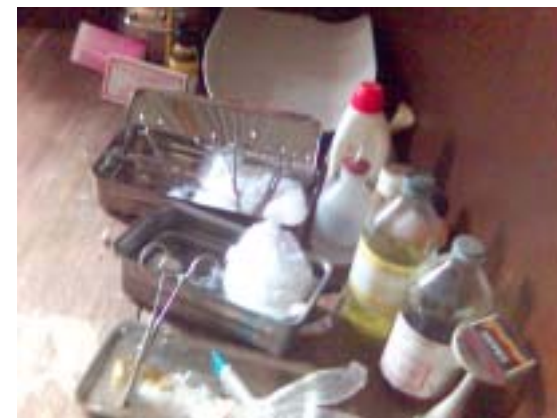
Quelques outils et produits divers

Ces appuis ont permis la reprise des activités de la matrone du village. Elle a servi la population locale en matière de prévention et des soins primaires de santé dans la zone et de ses environnements.