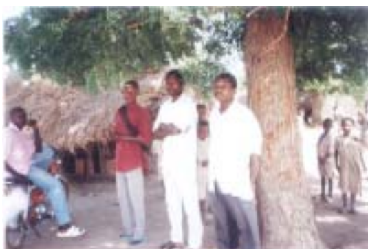
Les volontaires d'Atidomé-lété

L'école est devenue un facteur de rapprochement des 2 communautés ATIDOME et LETE longtemps opposées dans les approches de solutions aux problèmes d'éducation de leurs enfants.