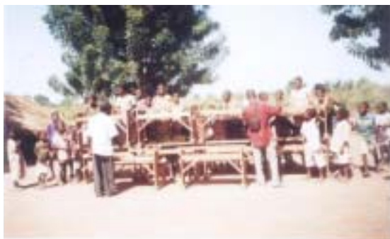
Don de 10 bancs pupitres à l'école.