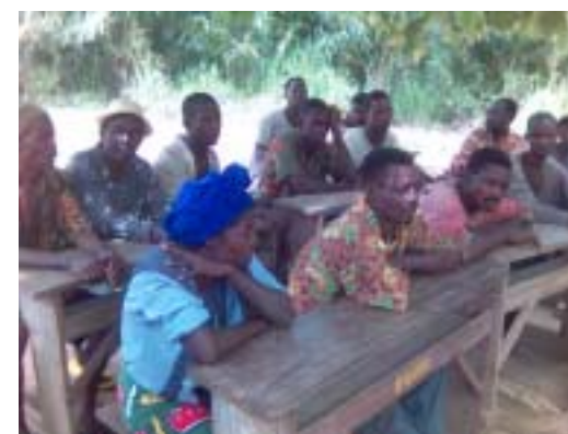
Rencontre équipe d'appui et comité de parents d'élève dans le hameau.

Des rencontres de mobilisation des moyens locaux et complémentaires se font pour la réalisation de ces projets à partir de 2006