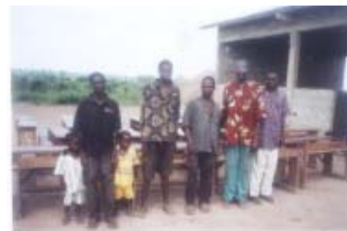
Le comité des parents d'élèves du village

Difficultés : Malgré la bonne volonté de la communauté la mobilisation des moyens financiers locaux est très difficile.