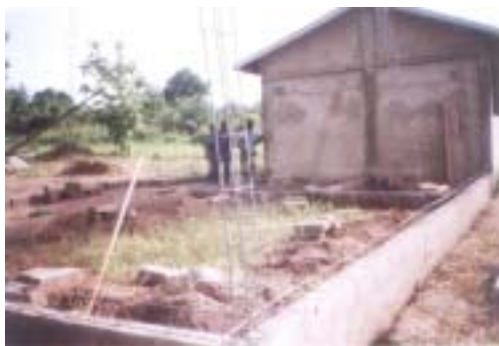
La construction de la fondation du bâtiment

L'équipe d'appui GADIS a réalisé les travaux de construction de la seconde salle de classe de 7m sur 5,50m et d'un bureau de 3m sur 5 m servant de direction.