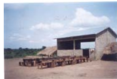
Construction de la salle de classe