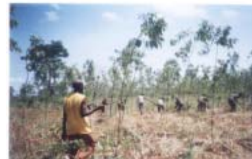
Le champ d'eucalyptus