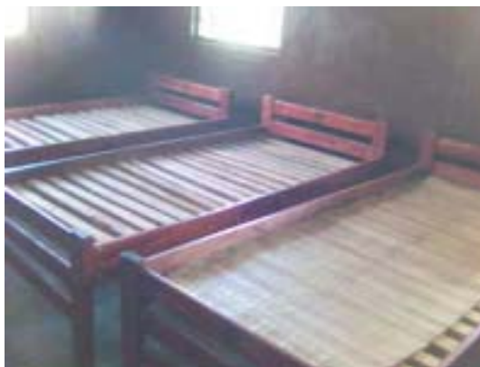
des lits sans matelas