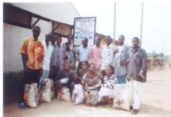
Voici un groupe de volontaires d'aides locales

C'est grâce aux apports financiers 2005 des amis de GADIS, que les responsables ont réussi à accompagner les 26 volontaires locaux et appuyer le bureau de coordination et les 11 unités d'aides des villages et hameaux dans l'exécution des activités et travaux d'amélioration des conditions de vie initiale.