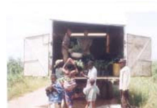
Transport des plants