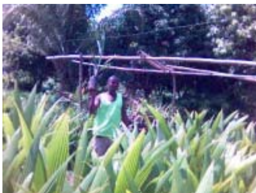
Pré-pépinière de cocotier

Les travaux de production des jeunes plants ont été réalisés avec des volontaires d'aides locales GADIS dans le village de Lavié-Kpota et Xose.