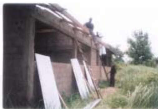
Les travaux de toiture en tôle

Ces appuis ont encore épargné les enfants des difficultés liées à l'éloignement des écoles du milieu et amélioré leurs conditions de vie scolaire dans le hameau.