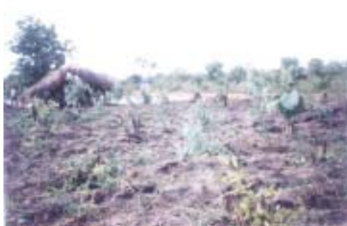
La plantation tout au tour de l'école

500 eucalyptus sont plantés sur la cours de l'école.