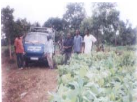
Transport des plants du village de Lavié sur les site des plantations.

GADIS a commencé ces travaux par la préparation des parcelles, la plantation et l'entretien des plants de tecks sur les superficies de 1 ha à Toxomé et de 1 ha à Dzogbé).