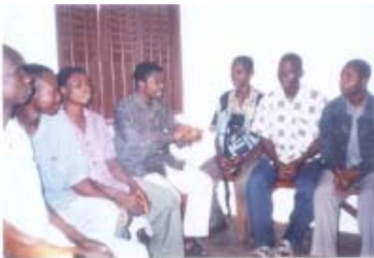
Une rencontre de mobilisation des volontaires