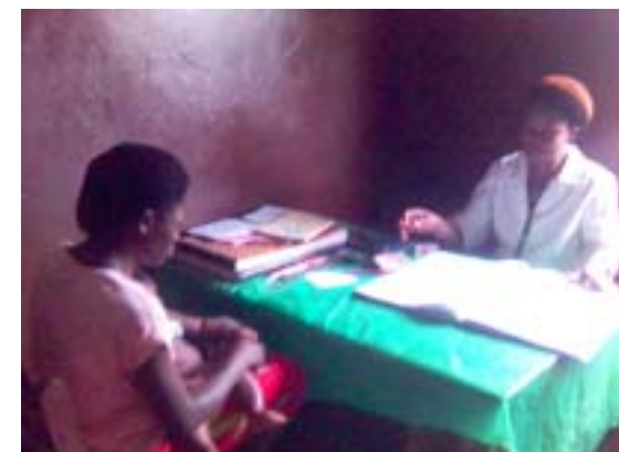
La matrone à la consultation.

Ces appuis ont permis la reprise des activités de la matrone du village. Elle a servi la population locale en matière de prévention et des soins primaires de santé dans la zone et de ses environnements.