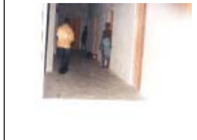
UASV - Santé à Dzatékpé La case en finition