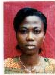
UAMG – Aide mutuelle Kpalimé La volontaire d'aide locale