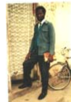
UAED – Elevage Kpalimé Le volontaire d'aide locale