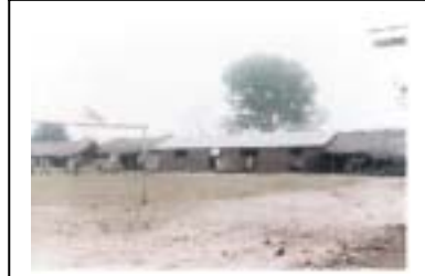
UAES – scolarisation à ALLOH. L'école