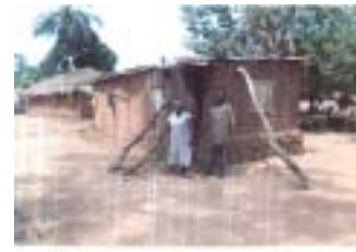
UASV-Santé TOXOME La case de santé