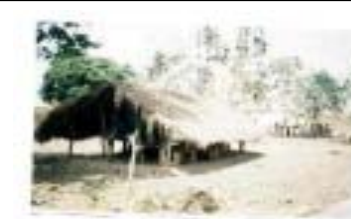
UAES- scolarisation TAGBADZA Une salle de classe