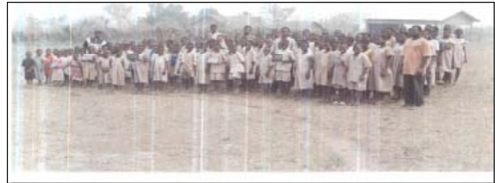
Photo des élèves, des 2 volontaires et de la construction de l'année