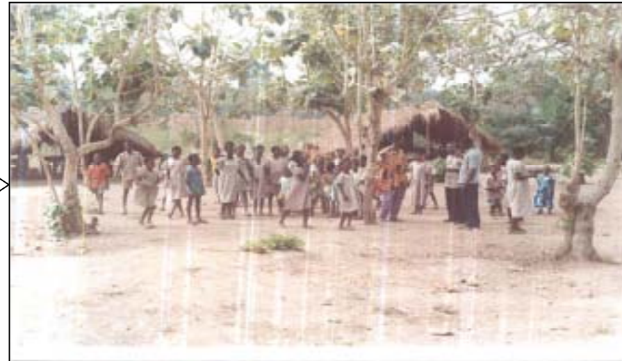
Photo des élèves, des 5 volontaires et de la construction de l'année